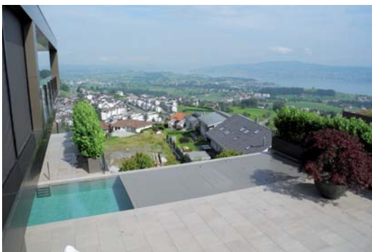
Bild linke Seite: In der totalen Ansicht des Gesamtprojekts kommt die Größenordnung zum Ausdruck. Architektur und Wasser verbinden sich auf beeindruckende Weise zu einem Projekt der Spitzenklasse.

Selbstverständlich sollte neben der Optik auch die Schwimmbadtechnik outständig sein. Und so entschied sich das Profiteam von Woodtli bei der Wasseraufbereitung für eine hochwertige Kombination aus Pumpen, Filter- und Dosieranlage, die über eine smarte Poolsteuerung automatisch abläuft. Ergänzt wird dieses Ensemble durch eine zuverlässige Heizung sowie eine Solarrollladenabdeckung, die bei Nichtbenutzung des Pools vor Wärmeverlusten und Verschmutzungen des Wassers schützt.